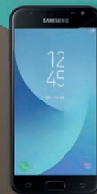
3. Preis: Samsung J5

Oder einen von zehn Gutscheinen in Höhe von jeweils 100,- Euro für den EWE Energiespar-Shop Einfach mitmachen! Teilnahmekarten liegen zu allen Veranstaltungen aus.