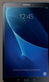
2. Preis: Galaxy Tab A 10 Zoll