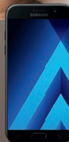
1. Preis: Samsung A5